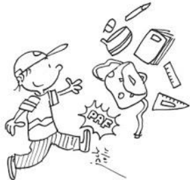
Prendre soin de son matériel