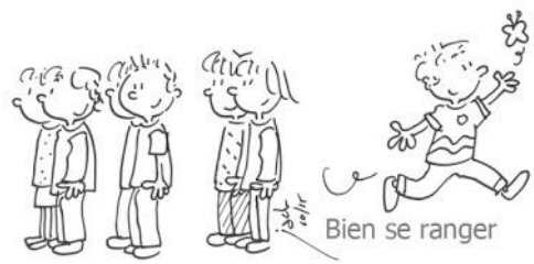
Bien se ranger