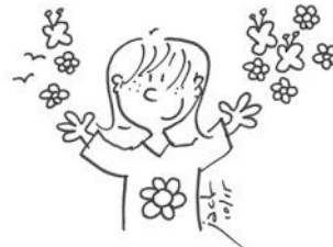
Avoir les mains propres