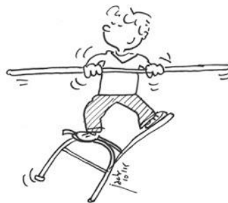
Ne pas se balancer