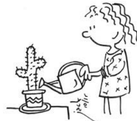
Faire son métier