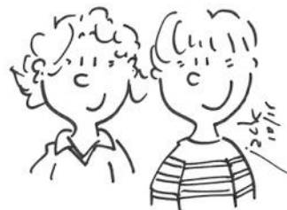
Ne pas faire la tête