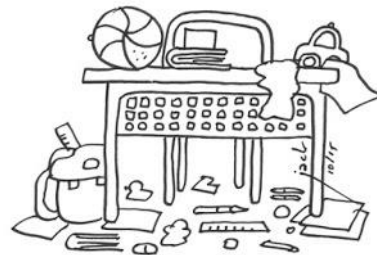
Ranger ses affaires