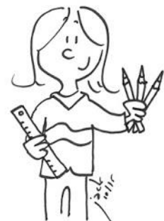
Avoir son matériel