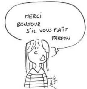
Etre poli et respectueux