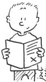
Faire signer les cahiers et les documents