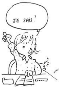
Bien apprendre ses leçons