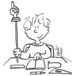
Lever le doigt