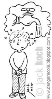
Aller aux toilettes pendant la récréation