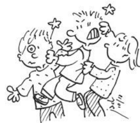
Ne pas se bagarrer