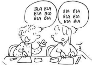
Ne pas bavarder