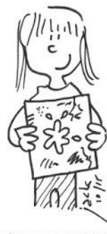
Soigner son travail